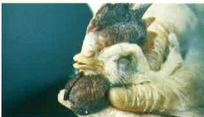
Cianose de crista e barbela