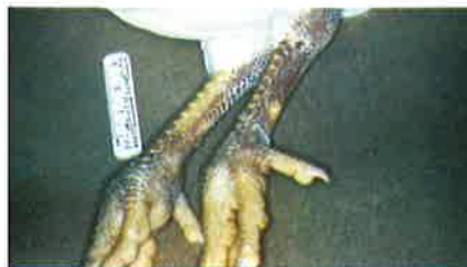
Cianose das extremidades